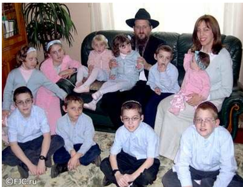
Zdjęcie 7. Ortodoksyjna rodzina żydowska