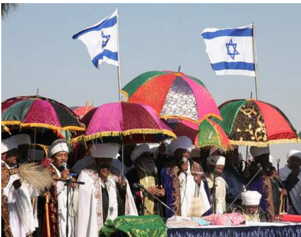
Zdjęcie 8. Falaszańscy duchowni pod osłona charakterystycznych parasoli.