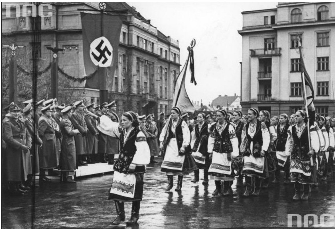
Niemiecko-ukraińska parada wojskowa w okupowanym Stanisławowie w 1941 roku

odnaleziono w Demianowym Łazie nieopodal wsi Pasieczna oraz w Posieczu.