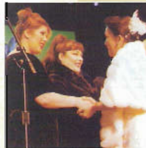
Carnie i Wendy Wilson

na koncercie dobroczynnym Jeden świat... pokoju poprzez muzykę w Los Angeles, Kalifornia, USA (1998)