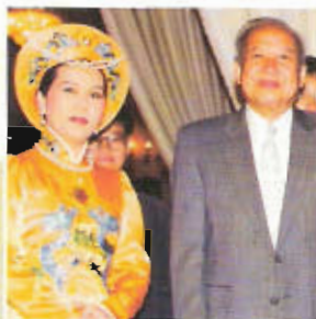
Król Preah Bat Samdech Preah Norodom Sihanouk Varman

powitał Najwyższą Mistrzynię Ching Hai w swoim królewskim pałacu w Kambodży i podarował jej wazę w dowód przyjaźni (1996)