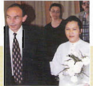
Gubernator Shirak Petrosyan

Gala Oskarowa Noc 100 Gwiazd w Beverly Hills, Kalifornia, USA (1999)