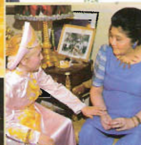
Była Pierwsza Dama Imelda Romualdez-Marcos Filipiny (2006)