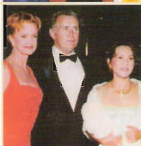
Zdobywczyni nagrody Emmy amerykańska aktorka Swoosie Kurtz oraz zdobywca nagrody Emmy i Złotego Globu amerykański aktor Martin Sheen.