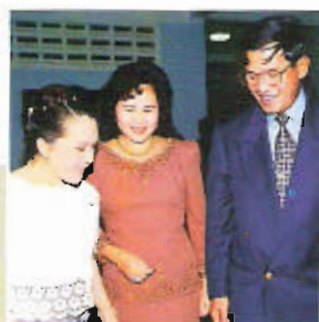
Premier Samdech Hun Sen z żoną Bun Rany