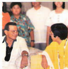
Wiceprezydent Salvador Laurel