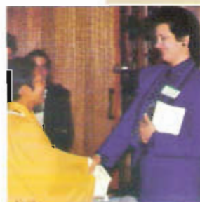
Była Pierwsza Dama Margarita Penón Góngora