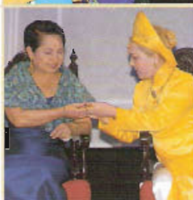
Prezydent Gloria Macapagal-Arroyo rozmawiała z Najwyższą Mistrzynią Ching Hai podczas ceremonii wręczenia Pokojowej Nagrody Gusięgo na Filipinach