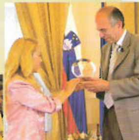
Prezydent dr Janez Drnovšek otrzymał od Najwyższej Mistrzyni Ching Hai Nagrodę za Wybitne Przewodnictwo na Świecie w Słowenii (2007)