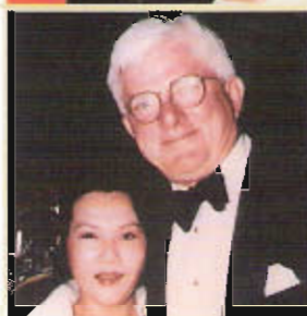
Wielokrotny zdobywca nagrody Emmy – amerykańska osobistość medialna Phil Donahue 19. doroczna gala dobroczynna dla szpitala St. Jude Children's Research w Beverly Hills, Kalifornia, USA (1999)