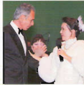
Bill Conti amerykański kompozytor zdobywca Oscara i nagrody Emmy

na koncercie dobroczynnym Jeden świat... pokoju poprzez muzykę w Los Angeles, Kalifornia, USA (1998)