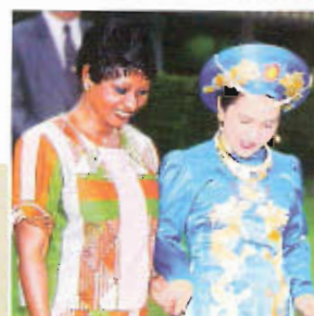
Pierwsza Dama Henriette Bedi