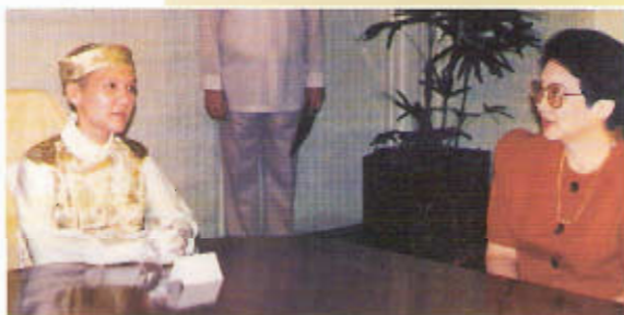
Prezydent Corazón Cojuangco-Aquino

powitali Najwyższą Mistrzynię Ching Hai w Indonezji (1993)