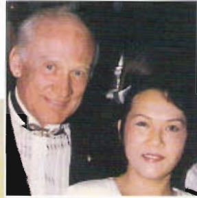
Amerykański astronauta Buzz Aldrin

Sławny amerykański aktor 19 coroczna gala dobroczynna dla szpitala St. Jude Children's Research w Beverly Hills, Kalifornia, USA (1999)