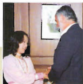
Peter Spalding Główny dowódca Amerykańskich Sił Zagranicznych