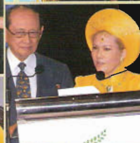
Były prezydent Fidel V. Ramos Filipiny (2006)