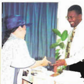
Premier Edison James