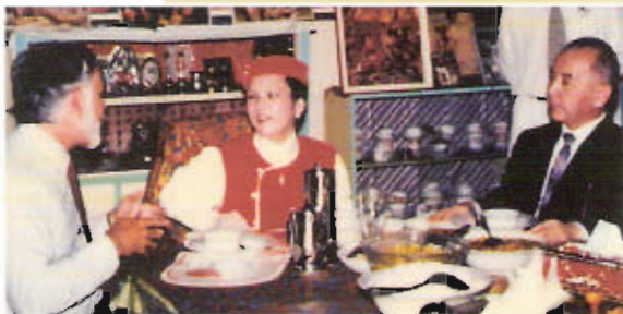
Konsulowie amerykański i japoński

powitali Najwyższą Mistrzynię Ching Hai w Indonezji (1993)