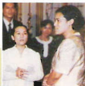
Księżniczka Maha Chakri Sirindhorn