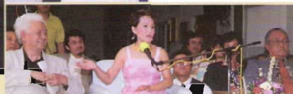
Najwyższa Mistrzyni Ching Hai podziwiała program Festiwalu Księżycowego z legendarnymi autackimi (wietnamskimi) kompozytorami Thu Hô (po prawej) i Phạm Duy (po lewej), uważanego za „Beethovena” Au Lac (Wietnamu), Kalifornia, USA (1997)