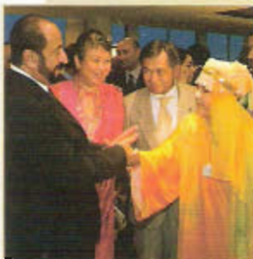
Przywódca Sharjah dr Sheikh Sulta bin Mohamed Al-Qasimi III w UNESCO we Francji (2007)