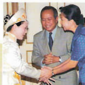
Księżę Norodom Ranariddh i księżna Marie Ranariddh