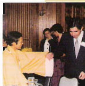
Prezydent Óscar Arias Sánchez