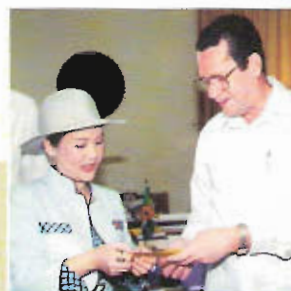
Prezydent Crispin Sorhaindo