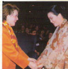
Kiêu Chinh znana aulacka (wietnamska) aktorka

ze słynnego zespołu Beach Boys Family & Friends na koncercie dobroczynnym Jeden świat... pokoju poprzez muzykę w Los Angeles, Kalifornia, USA (1998)